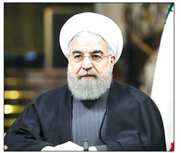
صاحبان تریبون، در یک آزمایش بسیار بزرگ قرار گرفته اند